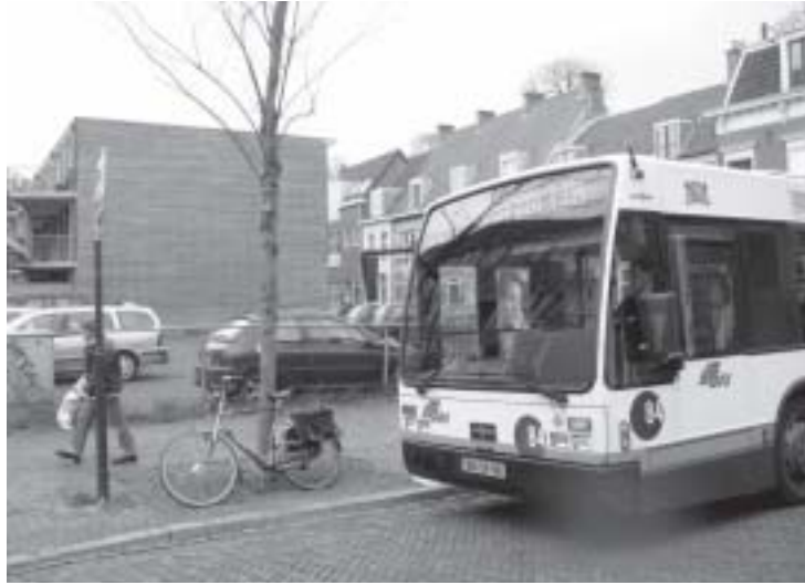
Halte Universiteitsmuseum

Het eerste gat openbaart zich direct naast de bushalte 'Universiteitsmuseum'. Aanvankelijk was hier een appartementencomplex gepland, maar inmiddels biedt het hoekje van de Vrouwjuttenstraat en de Lange Nieuwstraat al enige jaren ruimte als parkeerplaats. Eigenaar van de grond is de gemeente, die momenteel ijvert voor de verkoop van dit gebied.