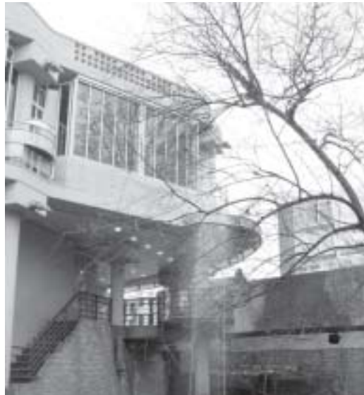
Gebouwen die weg kunnen. Eerst De Utrecht (Jugendstil) en nu het Muziekcentrum (Jaren Zeventig)

Ongevraagd hebben b. en w. de bevolking destijds allerlei beloftes gedaan, zoals wijkraden, de culturele zondag en een muziekpaleis in plaats van het muziekcentrum. Vooral van die derde belofte zullen heel wat mensen hebben opgekeken. Deugde het muziekcentrum dan niet meer? Ook gek. Het staat nog geen 25 jaar. 't Beton is nauwelijks droog. Een doolhof, maar verder toch in orde?