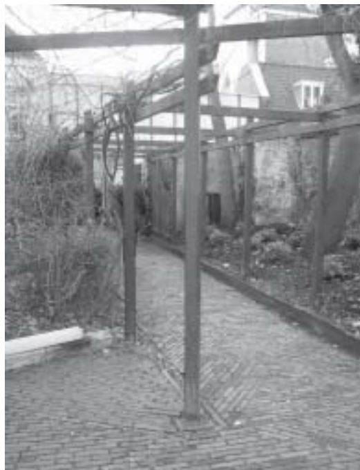
Rechts een deel van de nieuwe aanplant in de Abraham Dolehof; links onder een kapotte lichtarmatuur, die nog op reparatie wacht