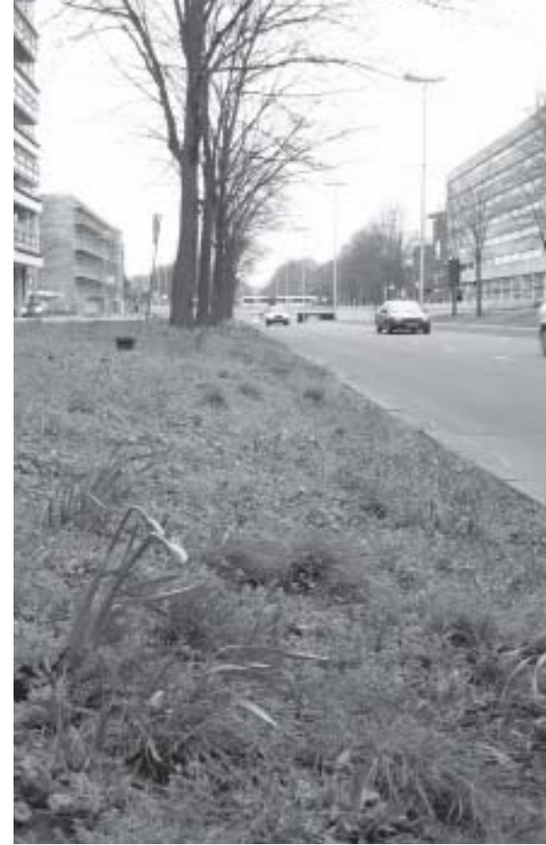
Groen aan de Catharijnebaan

In 2003 is een proef gehouden om bij een aantal evenementen de geluidsnorm van 80 dB te verruimen tot 90 dB. Hoewel de Wijkraad nog niet is geïnformeerd over de resultaten van de proef, heeft zij toch al een advies uitgebracht. De Wijkraad wijst erop dat algemeen bekend is dat bij geluidsniveau's van 90 dB of meer gehoorschade kan optreden. Bovendien is dit risico groter in smalle straten waar een geluidsniveau van 90 dB al snel kan stijgen tot