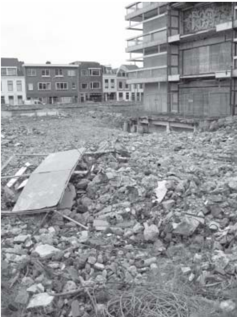
'Ground Zero' Groenestraat-ABC-Straat

Even verder ligt de Eligenhof. Een knus hofje dat al lange tijd wordt overwoekerd door een heuvel van gras en modder er recht tegenover. Ook hier zijn de bouwplannen door de ontwikkelingen in de huizen-