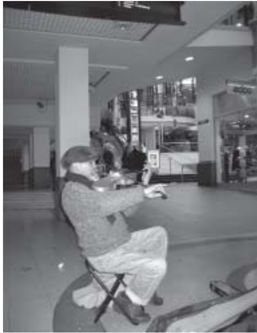
Zondagmiddag in Hoog-Catharijne

De VVD is blij met de komst van de Lucasgarage. Het werd tijd om te investeren in een meer gespreide verdeling van garages en uitbreiding van parkeerplaatsen in de Binnenstad. Voor het eerst kiest deze stad voor een duurzame oplossing van parkeren onder de grond. Groen boven, blik beneden. Zo zal het eigenlijk rond de hele Binnenstad moeten.