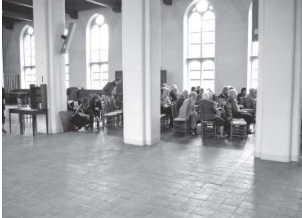
Zondagse dienst in een hoekje van de Leeuwenberghkerk