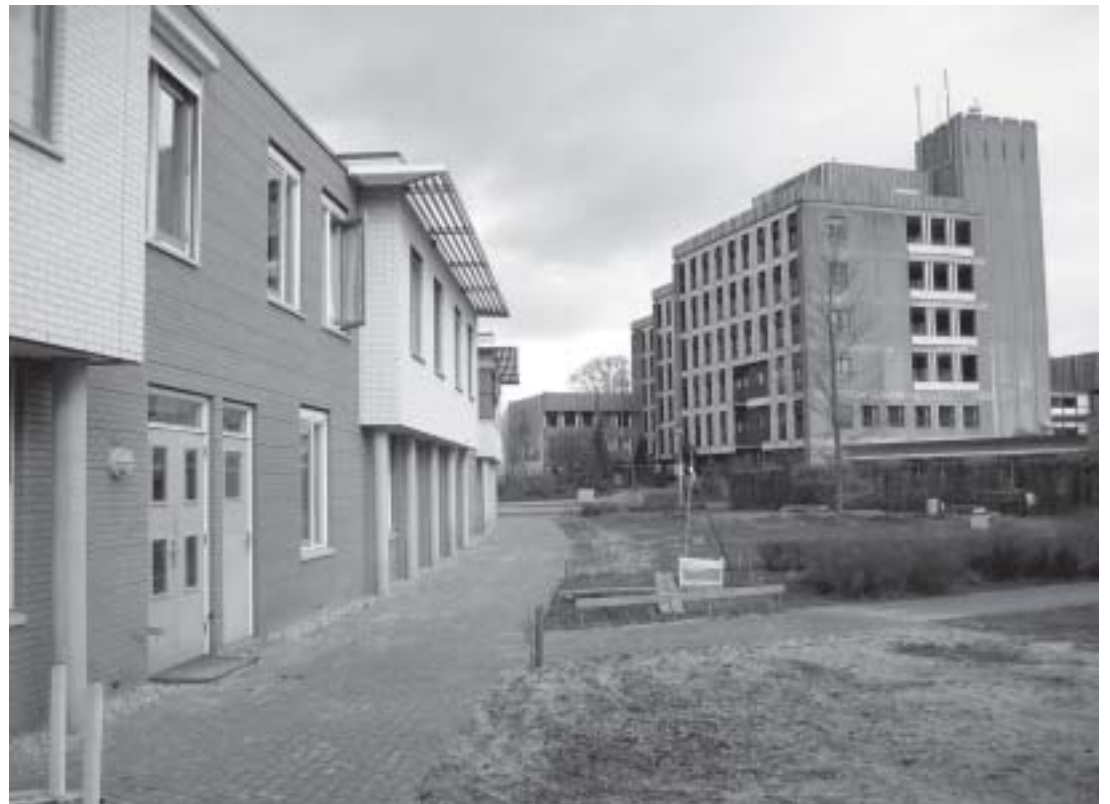
Binnen terrein Willem Arntz-huis

Van binnen wordt alles grotendeels in de oorspronkelijke staat hersteld, aan de markante buitengevel verandert niets, behalve dat de natuurstenen bekleding wordt schoongemaakt en dat er nieuwe kozijnen komen.