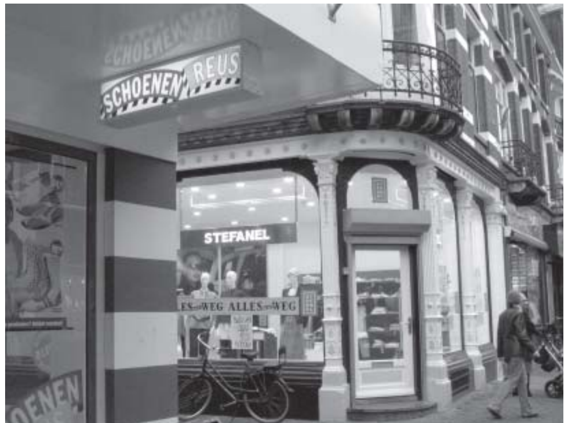
Een steeds eenzijdiger aanbod: schoenen en kleding, kleding en schoenen