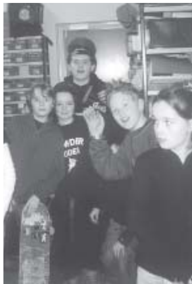
De kinderraad presenteert

lijke verdeling voor, aangezien de kinderraad speciaal voor kinderplannen is, waar de gemeenteraad misschien niet altijd aan denkt. Wanneer de gemeenteraad nou het groen en het verkeer