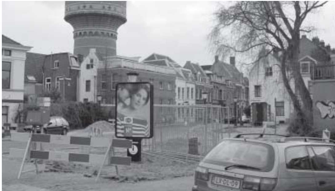
Het nieuwe plein in aanleg

Als alles goed gaat kunnen de werkzaamheden in week 18 worden afgerond. Precies op tijd voor de vrijmarkt.