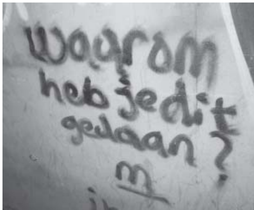
Dit is voortaan verleden tijd