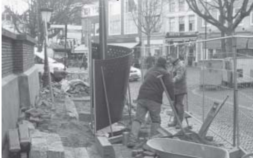
Plaatsing van de Plasmast op de hoek Neude-Drakenburgstraat

Wildplassen stinkt en het is een onaantrekkelijk gezicht. Helaas zijn er regelmatig mannen die de openbare ruimte als urinoir gebruiken, vooral in de omgeving van horeca. Om de overlast daarvan te verminderen